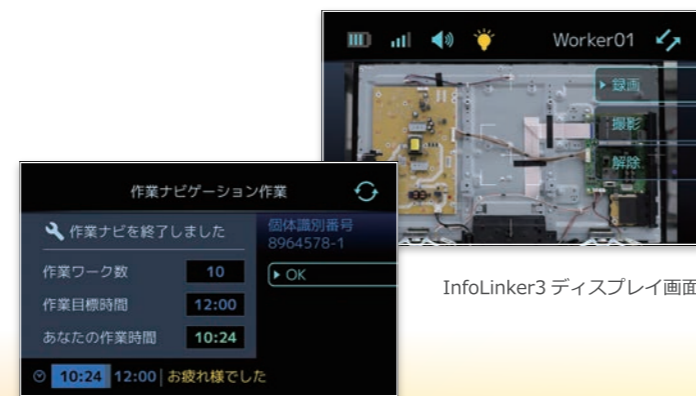
InfoLinker3 ディスプレイ画面